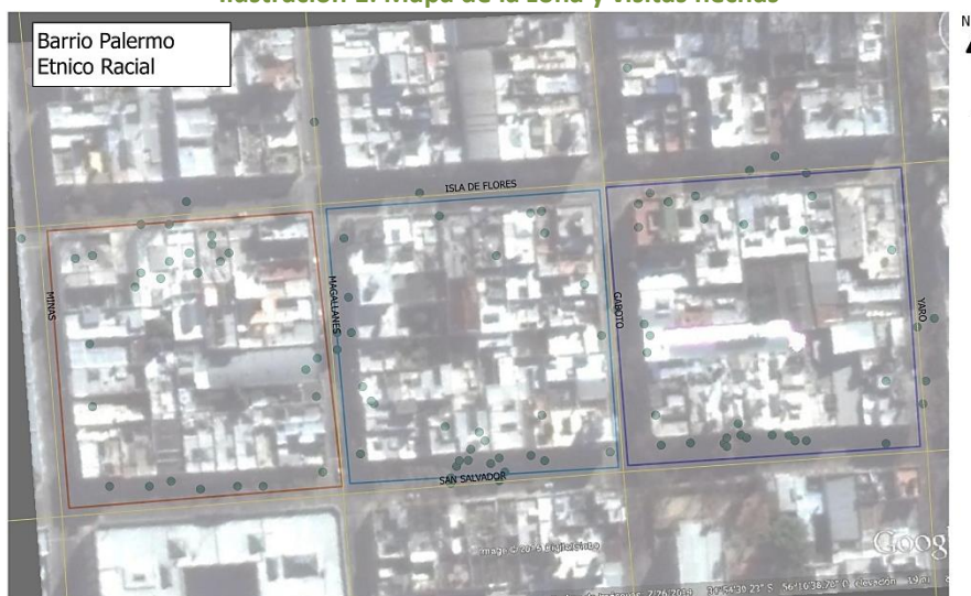
Ilustración 1: Mapa de la zona y visitas hechas